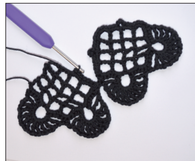
2:a hjärtat: Hopvirkning på varv 6