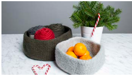
Sid 3. Filtad korg i Felting Wool