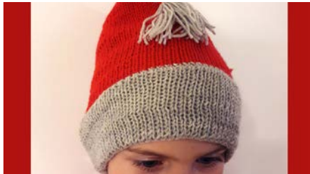
Sid 8. Tomteluva i Merini