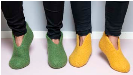
Sid 1. Filtade tofflor i Felting Wool