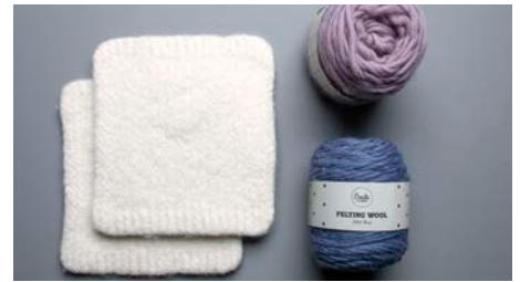
Sid 5. Filtat grytunderlägg/ grytlapp i Felting Wool