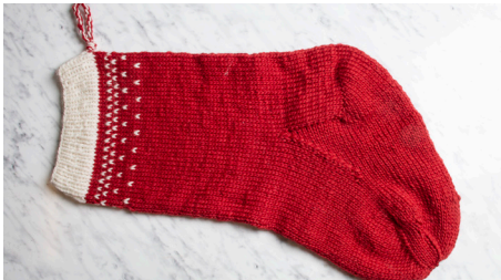
Sid 6. (Jätte)julstrumpa i Felting Wool